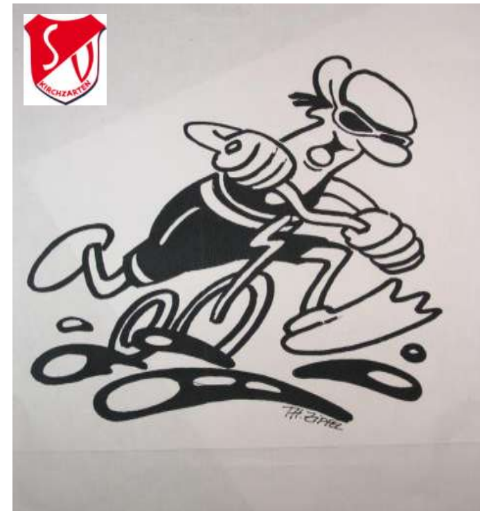
Freddy: „Auch Du kannst Duathlon!“